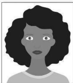
Figura 1. Modelo de Foto Frontal

VII - Preferencialmente tamanhos 5cm x 7cm (ou superior).