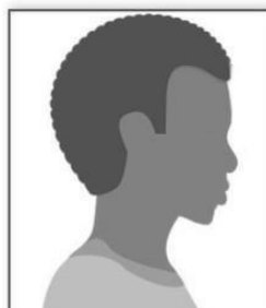
Figura 2. Modelo de Foto de Perfil