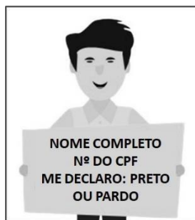
Figura 3. Modelo de Autodeclaração para o vídeo.